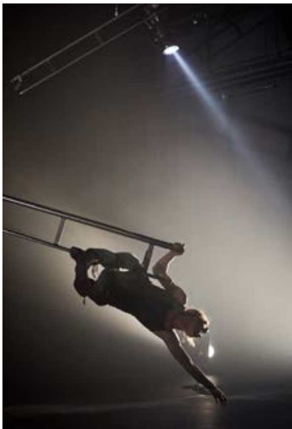
Noir M1 Mélissa Von Vepy Création 2018