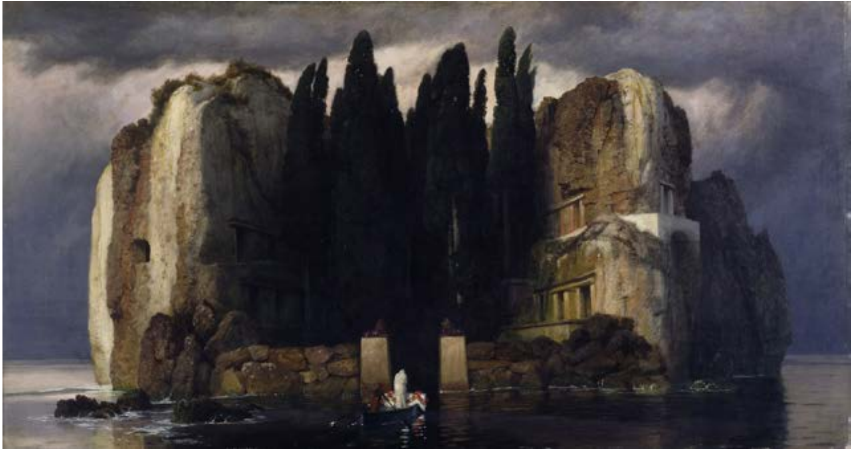
L'Île des Morts Arnold Böcklin 1880