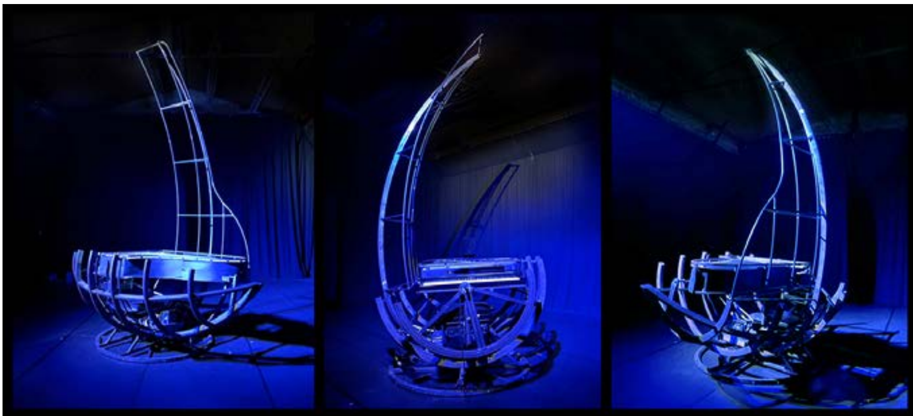
Structure en cours de construction