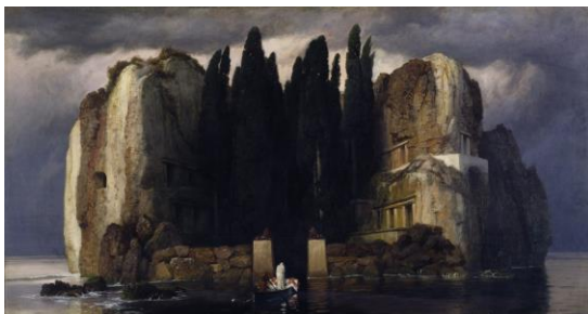
L'île des Morts - Arnold Böcklin (1880)

« Je me suis habitué à la mort : un pianiste est un homme déguisé en croque-mort, avec en face de lui, constamment, son piano qui ressemble à un corbillard. » Arthur Rubinstein