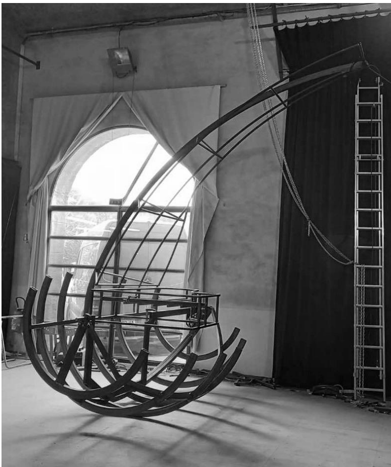
structure en cours de construction mars 2022

Ce navire flotte sur la terre ferme, c'est un vaisseau sonore. Il tangue en un voyage sans fin, jusqu'à l'autre monde. Tentative de rapprochement avec l'invisible, avec les âmes de ceux qui, avant nous, s'en allèrent. Le capitaine est musique, la femme est vent, son souffle anime cet étrange piano-bateau ; Tous trois, instruments de passage, émetteurs-transmetteurs inextricables.